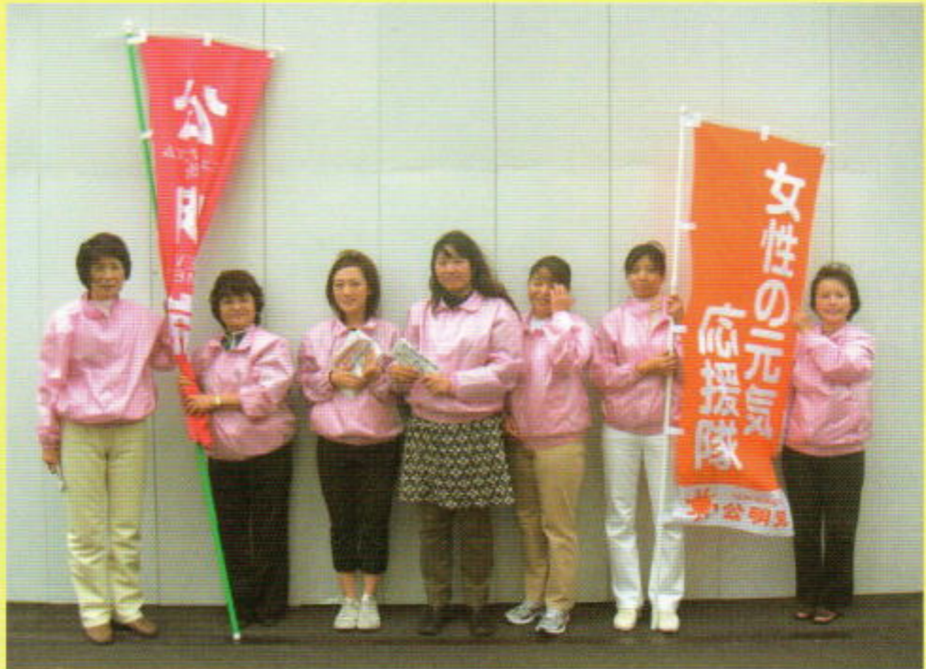
街頭演説に応援頂いた 女性党員の皆さん