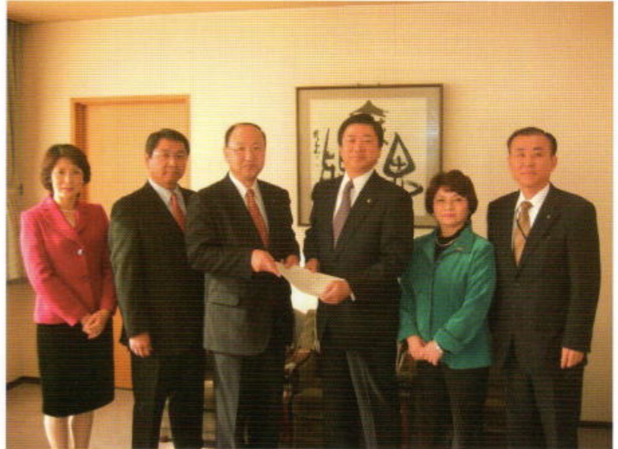
長友市長に「予算要望書」を渡す公明党市議団

平成21年第四回調布市議会定例会が12月2日から17日までの16日間の日程で行われ、「市長提出議案26」「議員提出議案21」「陳情4」が審議されました。また一般質問は19人の議員が行ない、市政全般に関し市長に質問をしました。公明党からは4人の議員が質問に立ちました。